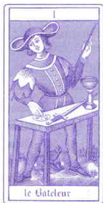
TAROTUL LUI OSWALD WIRTH